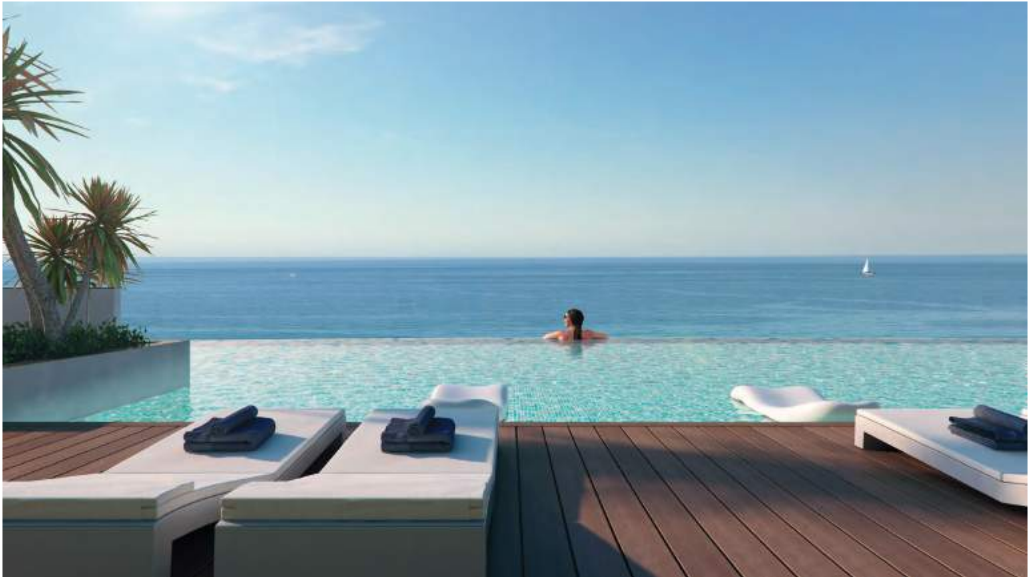
Piscina desbordante Infinity edge pool