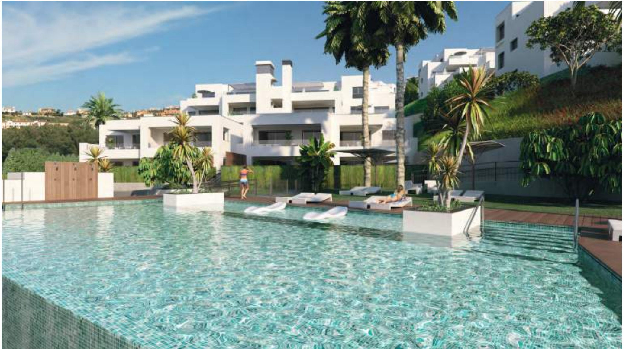
Piscina con tumbonas sumergidas Underwater tanning ledges pool