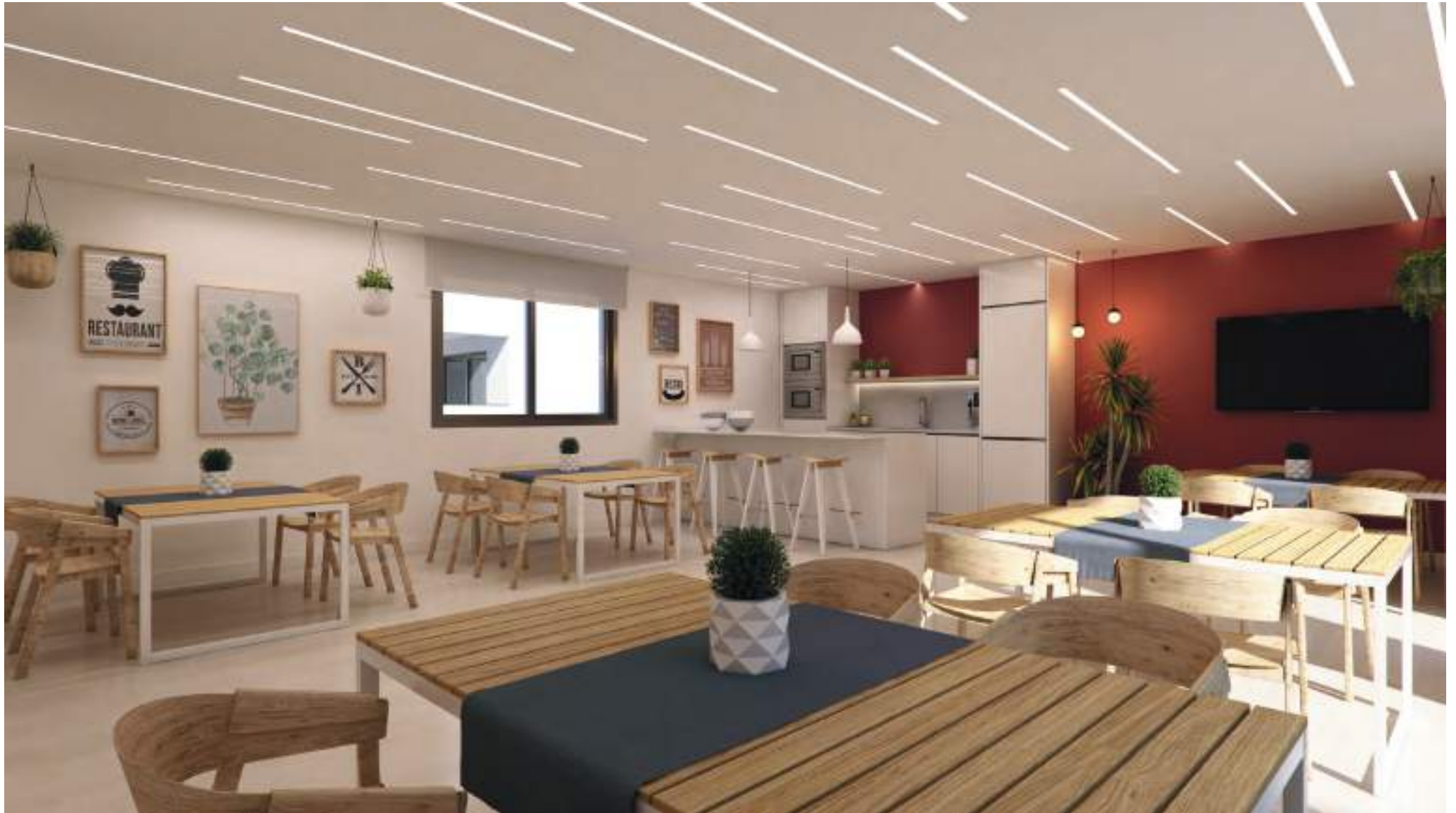
Zonas comunes: sala gourmet y coworking. Ammenities: gourmet room and coworking area.