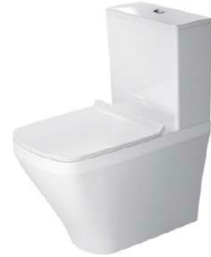
Inodoro a suelo adosado a pared. Modelo Durastyle de Duravit. Duravit Durastyle floor-mounted toilet, fitted against wall.