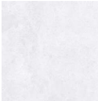
Verse White 60x60 cm

En los baños el pavimento será el mismo que en el resto de la vivienda. Gres porcelánico rectificado formato 60x60 cm marca Keraben, modelo Verse White. Las paredes que no vayan alicatadas llevarán rodapié a juego con el pavimento.