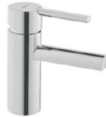
Grifería lavabo monomando modelo Balance de Gala. Gala Balance washbasin mixer tap.