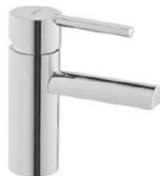
Grifería lavabo monomando modelo Balance de Gala. Gala Balance washbasin mixer tap.