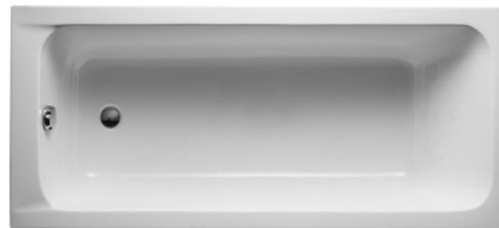
Bañera modelo D-Code de Duravit. Duravit D-Code bathtub.