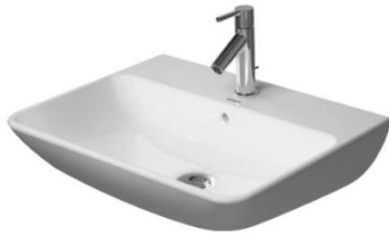
Lavabo suspendido de un seno Modelo Me by Stark de Duravit. Duravit Me by Stark wall mounted single washbasin.