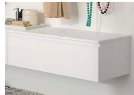
Mueble suspendido bajo lavabo Modelo Spirit de Salgar. Color blanco brillo. Salgar Spirit wall-mounted unit below washbasin. Gloss white.