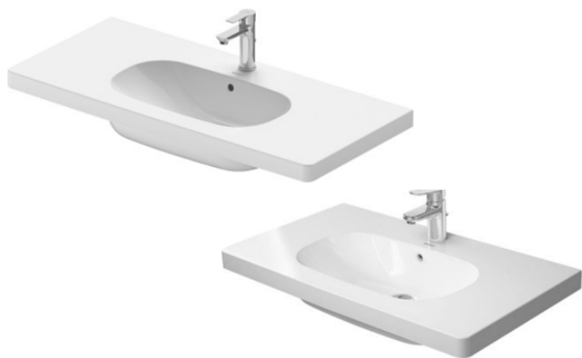
Lavabo suspendido de un seno Modelo D-Code de Duravit. Single Duravit D-Code model wall-mounted washbasin.