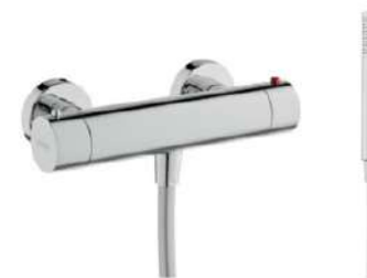
Grifería ducha termostática modelo Balance de Gala. Thermostat-controlled Gala Balance shower tap set.

COMPLEMENTOS INCLUIDOS: Espejo Antivaho.