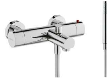
Grifería bañera termostática modelo Balance de Gala. Thermostat-controlled Gala Balance bathtub tap set.

COMPLEMENTOS INCLUIDOS: Espejo Antivaho.