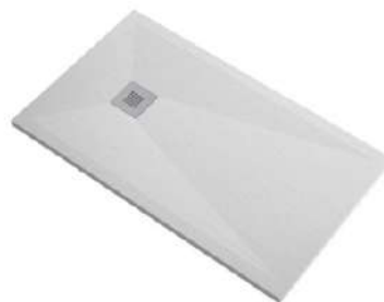
Plato de ducha modelo Oporto de Newker. Oporto shower tray.