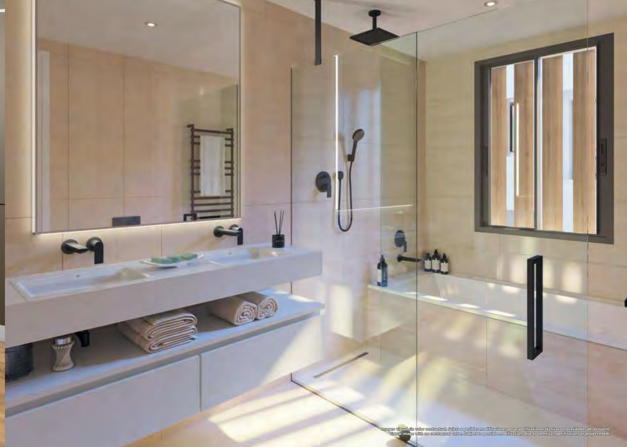
Imagen virtual sin valor contractual. Sujeta a posibles modificaciones por especificaciones técnicas o necesidades del proyecto. Virtual image with no contractual value. Subject to possible modifications due to technical specifications or project needs.