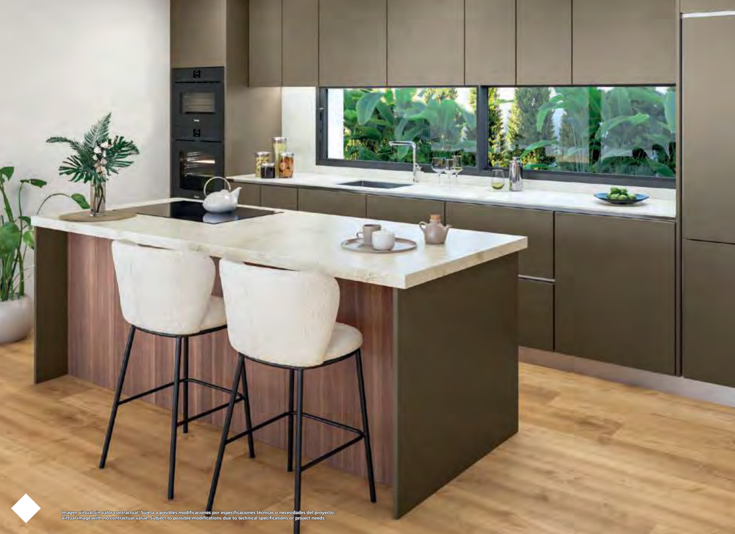
Imagen virtual sin valor contractual. Sujeta a posibles modificaciones por especificaciones técnicas o necesidades del proyecto. Virtual image with no contractual value. Subject to possible modifications due to technical specifications or project needs.