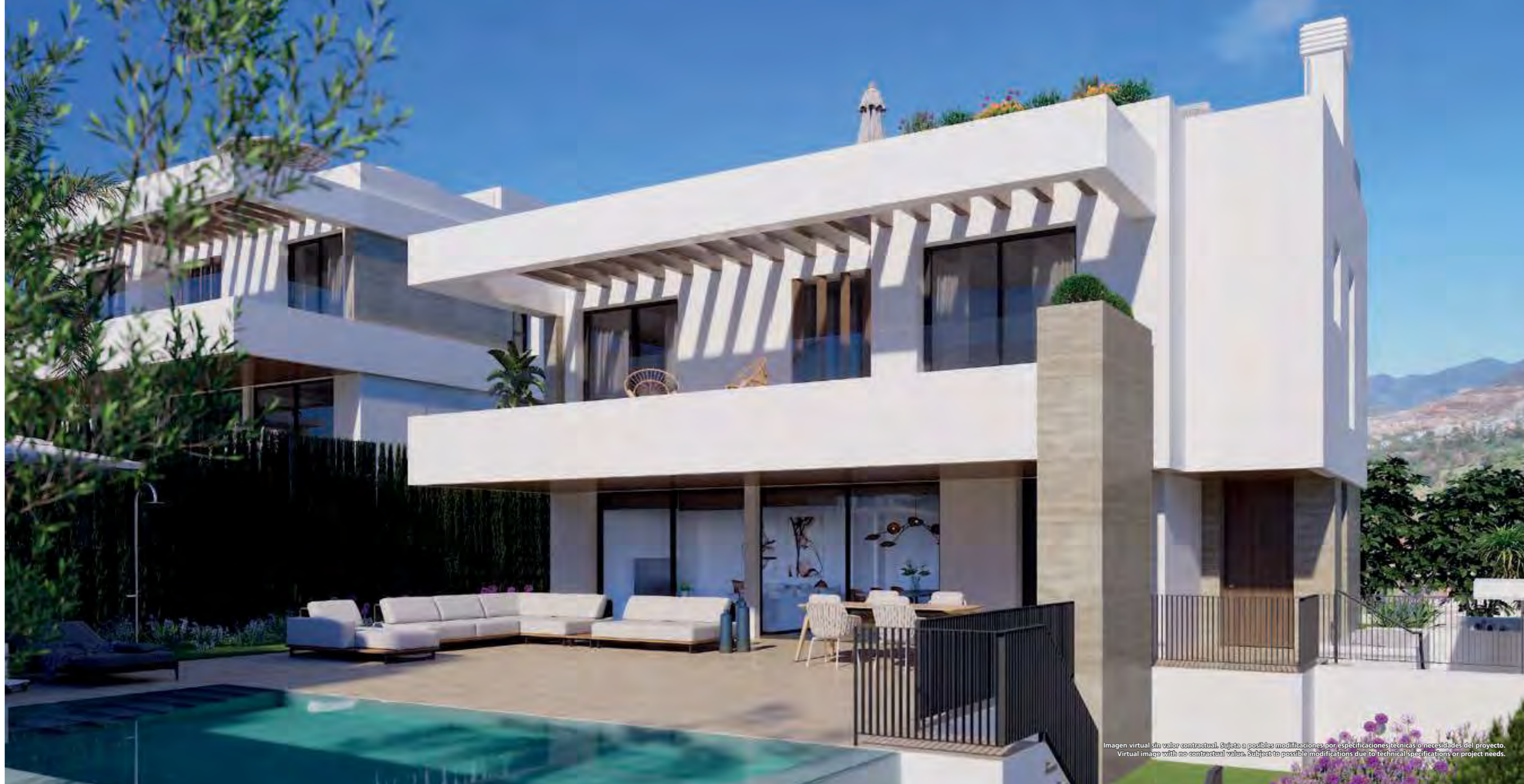
Imagen virtual sin valor contractual. Sujeta a posibles modificaciones por especificaciones técnicas o necesidades del proyecto. Virtual image with no contractual value. Subject to possible modifications due to technical specifications or project needs.

Seven Diamonds by TM ateniza para lucir su diseño cuidado, mimetizándose con las zonas verdes y los azules de la piscina y el cielo.