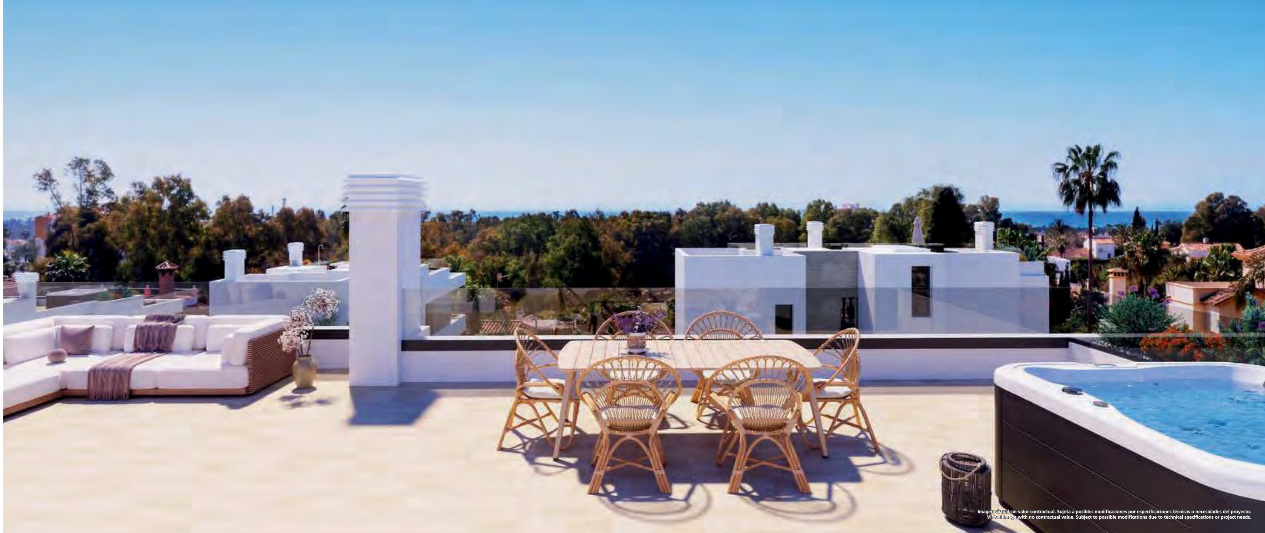
Imagen virtual sin valor contractual. Sujeta a posibles modificaciones por especificaciones técnicas o necesidades del proyecto. Virtual image with no contractual value. Subject to possible modifications due to technical specifications or project needs.

From the solarium, you can see the Mediterranean Sea on the horizon and, thanks to the private garden with its swimming pool and the solarium with hot tub, you can take a dip, relax and enjoy yourself. We have taken care of every last detail for you, no matter how small.