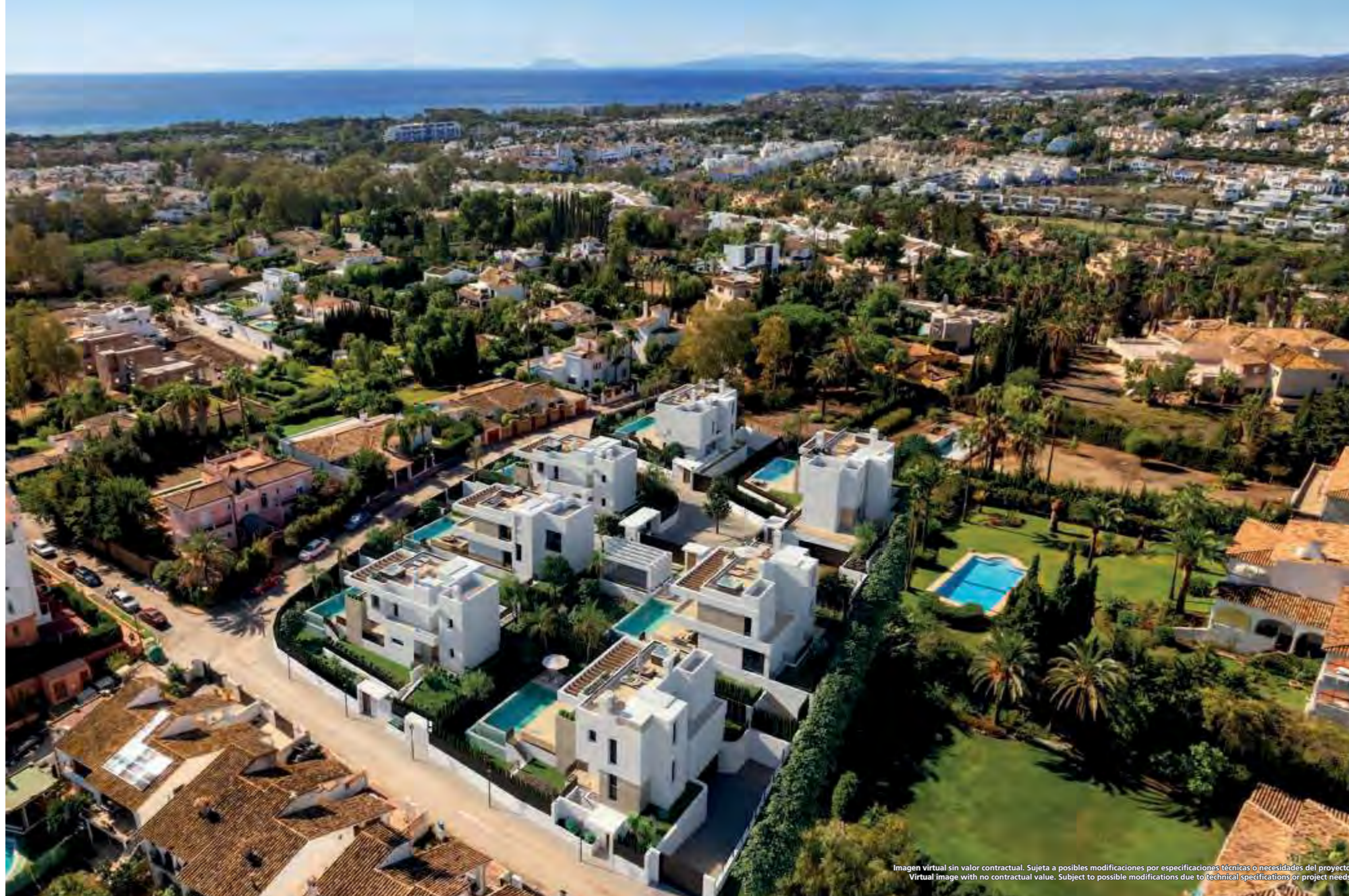
Imagen virtual sin valor contractual. Sujeta a posibles modificaciones por especificaciones técnicas o necesidades del proyecto. Virtual image with no contractual value. Subject to possible modifications due to technical specifications or project needs.

Desde el solárium de las villas, podrás ver en el horizonte el mar Mediterráneo y, además, la playa del Saladillo y la playa de Guadalmanza son perfectas para tomar un cóctel en sus chiringuitos.