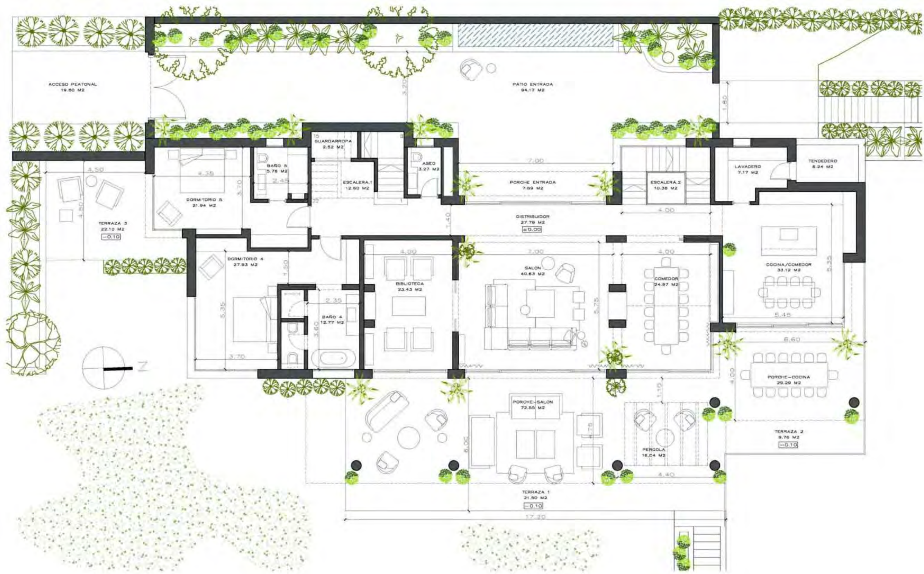
Planta Baja_Nivel +0