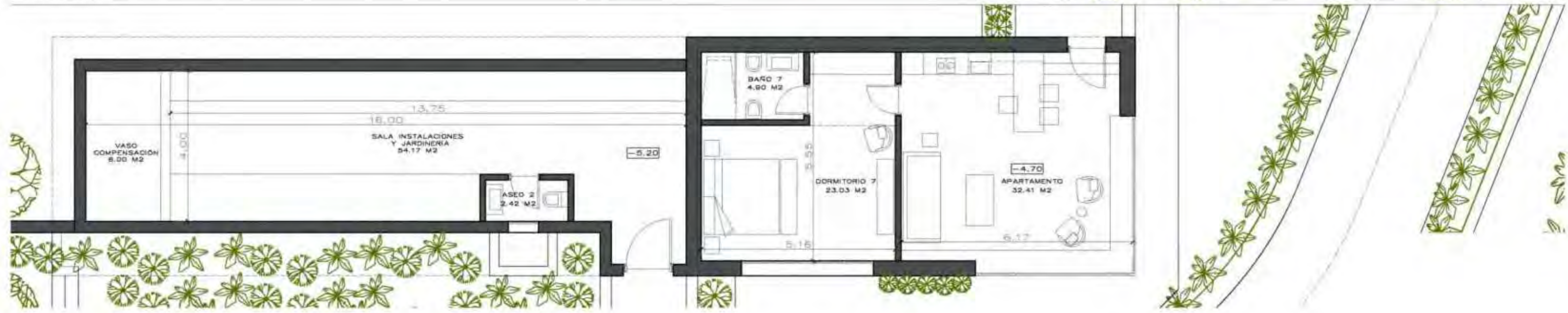
Planta Sótano_Nivel -1