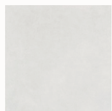
Model White 120x120 cm.

En los baños el pavimento será de gran formato y colocado de suelo a techo continuo. Gres porcelánico rectificado marca PORCELANOSA o similar.